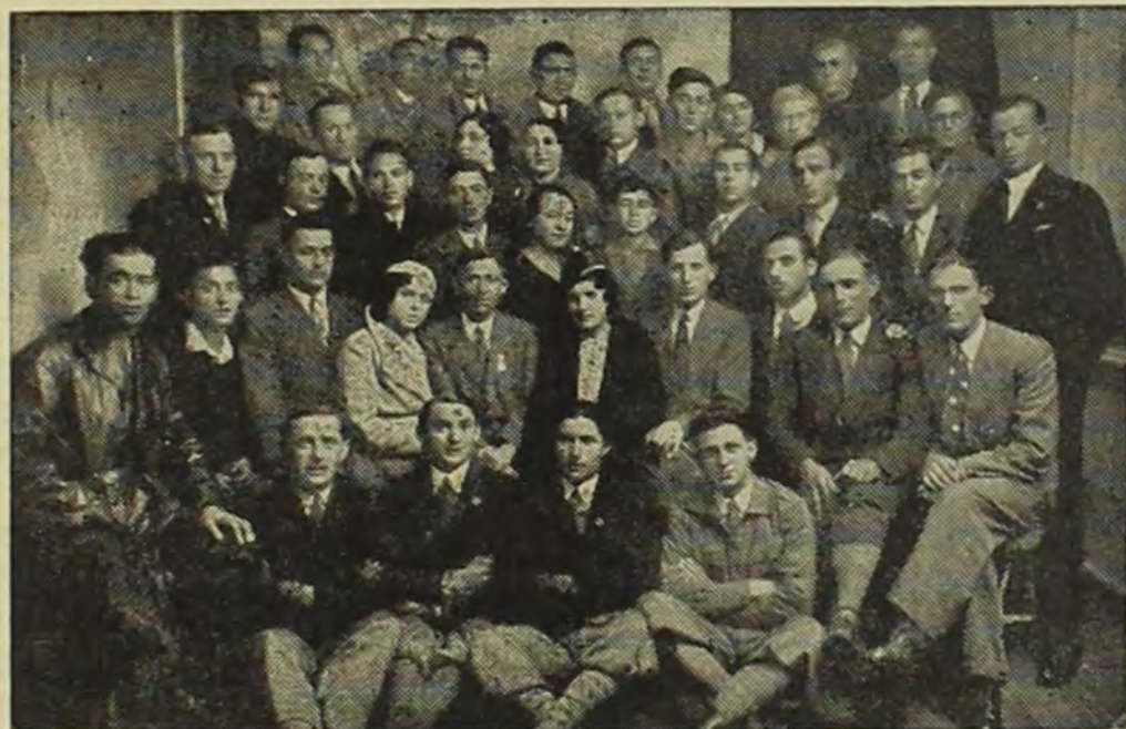
קיבוץ החלוץ הכלל-ציוני ברובנה ב-1932

רובנה הציונית צעדה בתקופה בין מלחמה למלחמה צעדים גדולים. היא עמדה בראש ערי ווהלין, ונתפרסמה לשבח בעולם היהודי והציוני כולו. על כך יעידו גם הכינוסים, הועידות והביקור-רים של ראשי התנועה הציונית ודבריה שהיו ברובנה מזמן לזמן. בעיר התקיים כינוס מחוזי