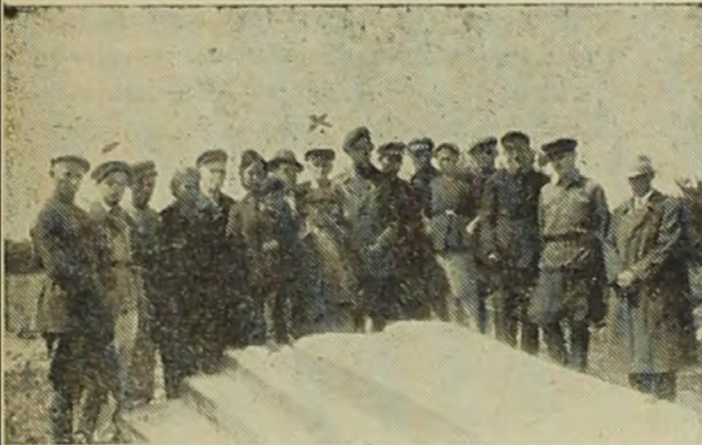
קברי האחים ליד סארני

מיד פתחתי את הדלת ואנשי הבית הכירוני "א סארנער יונגעל" (נער סרנאי). הרגשתי את עצמי בתוך עמי, בין אחים רחמנים. עוד אני נרגש ונסער - הושיבוני והאכילוני, גם נתנו לי להחליף בגדים ורבה היתה השמחה בבית. שם מצאתי כמה משפחות סארנאיות. שאלתי וחד-קרתי לקרובי, למכירי ולחברי ועל כולם באה תשובה: לא ידוע, אינם. שמעתי על גידור הק-ברים הגדולים שבלעו את יהודי סארני, דומברו-ביצה, ברז'נה, רוקיטנה, קליוסובו ועוד, על אכזריות הנאצים ועל שיתוף האוקראינים והפור-