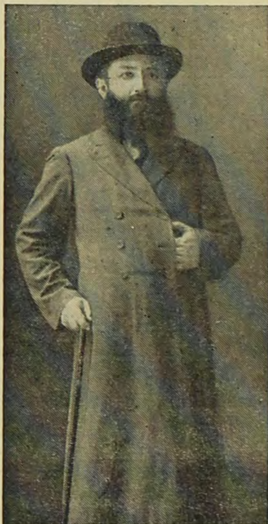
תקל"ז (1876) — תרפ"א (1921)

לדעת בני-משפחתו נכנסה בו רוח-שטות בימים ההם, הליכותיו נראו להם מוזרות. הוא, האדוק ושומר-מצוה קפדן, מתהלך עם הציונים ודוקא עם הצעירים, גומר את ההלל על בחורי העיר ליה השניה ומטיח דברים כלפי הישוב הישן, שנחשב לקדוש בעיניהם. יתר על כן, הרגישו בו שממעט בלימודו ומקדיש תשומת-לב לפרה ול-עגל שהמליטה, לתרנגולות ולאפרוחים שהתחילו לגדלם, וכן לגינה ולעצים שלידי ביתו. לעתים