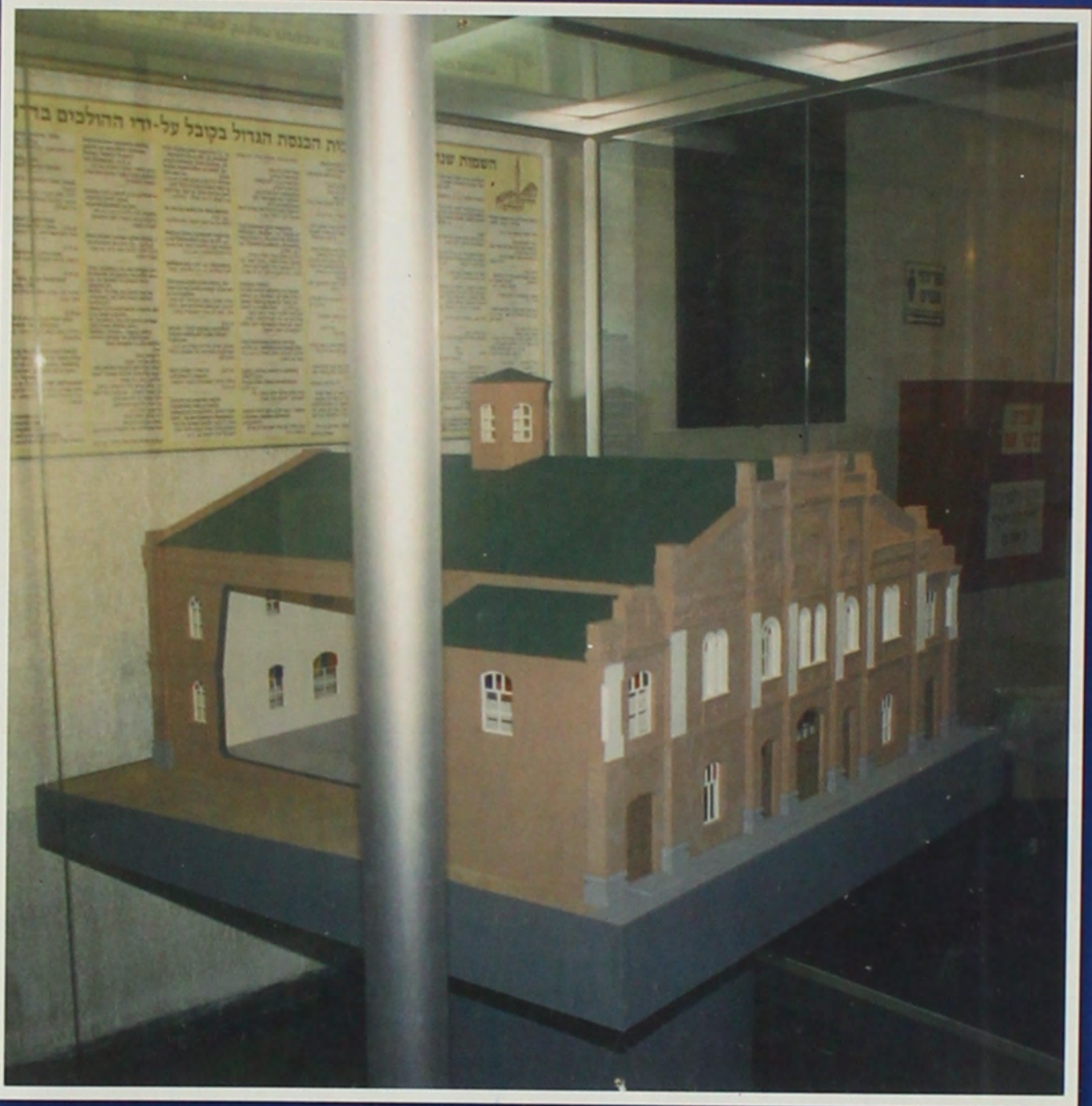
דגם בית הכנסת הגדול בקובל