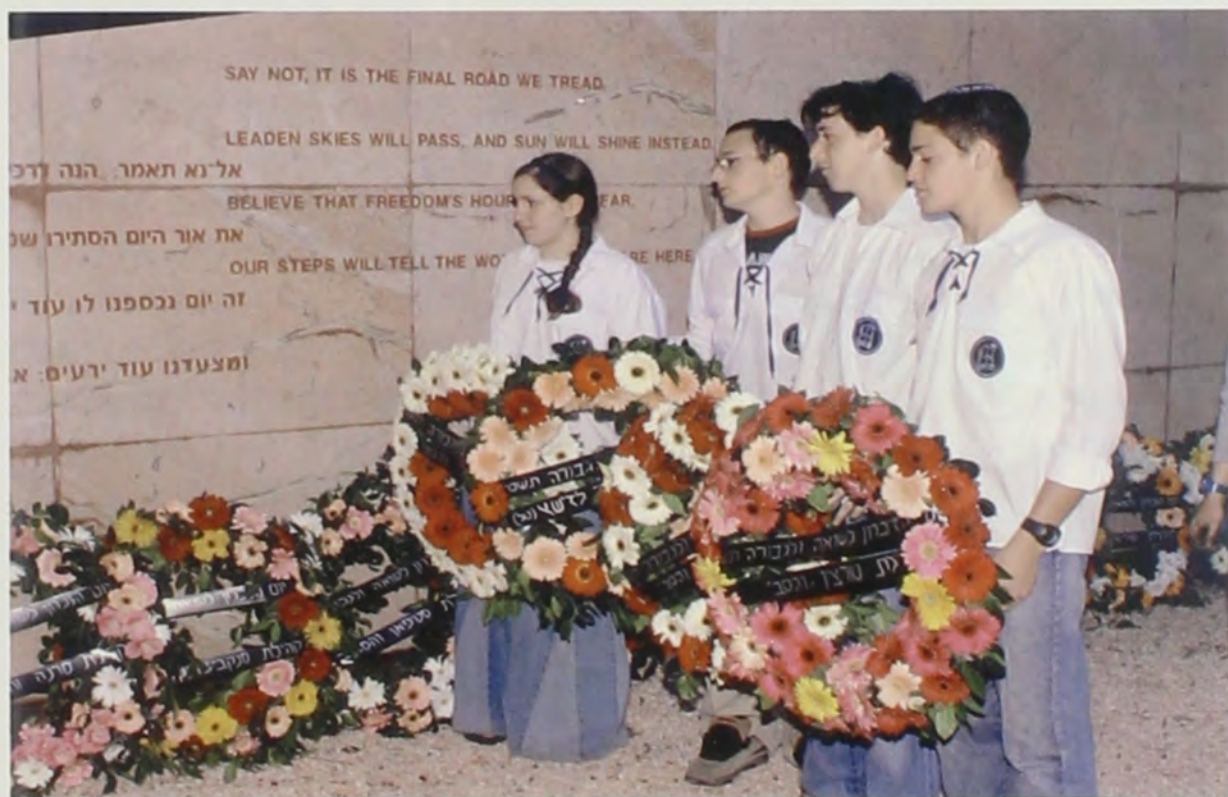
חניכי תנועת הנוער בני עקיבא משתתפים בטקס יום הזכרון לשואה ולגבורה