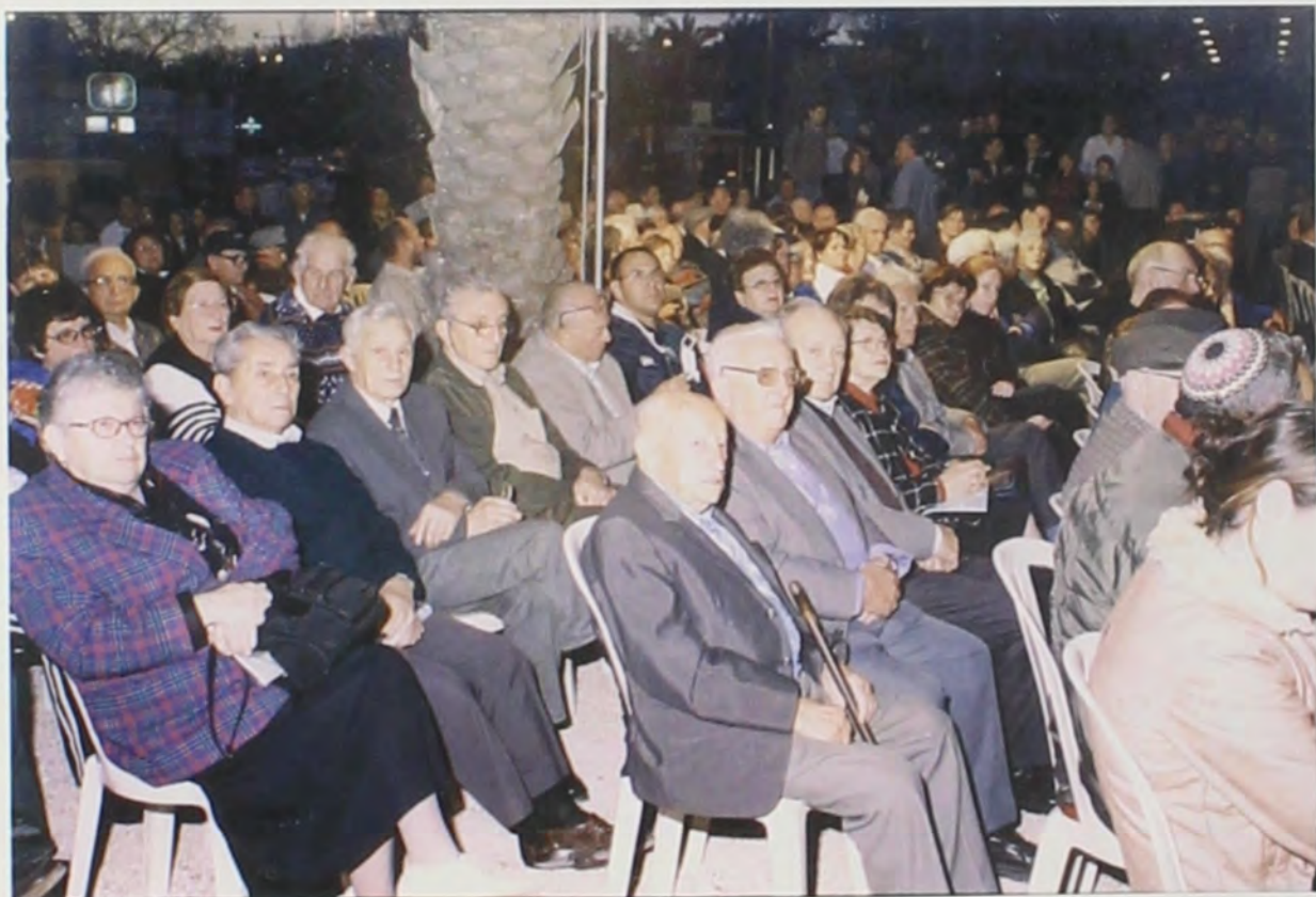
הקהל בטקס יום הזכרון לשואה ולגבורה